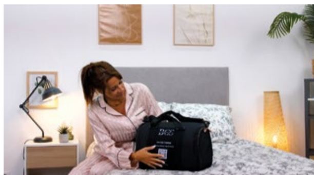
Mit einem Reise-Topper und -Kopfkissen in jedem Hotelzimmer wie zuhause fühlen.

für uns Gold wert.“ Besonders schätzt der Familienunternehmer die direkte Kommunikation: „Man hat immer jemanden dran, der weiß, wovon man spricht.“ Seit 2013 ist das Unternehmen am Markt und möchte über Deutsch-