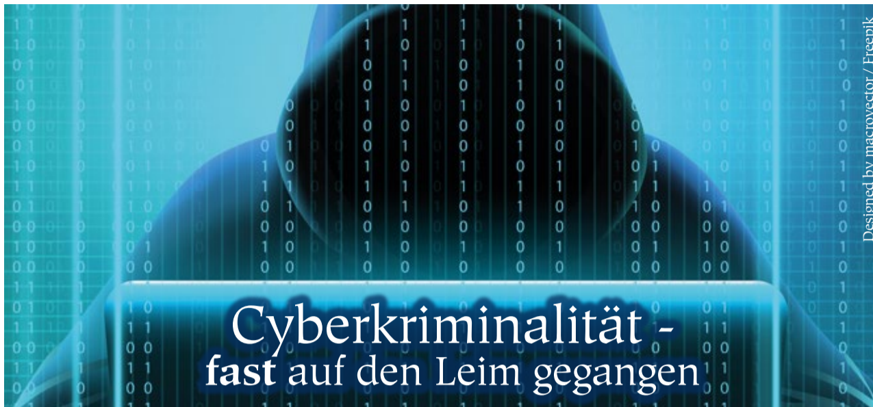
Designed by macrovector / Freepik